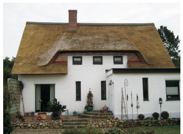
Nach ca. 4 Monaten natürlicher Bewitterung

Aktiv-Dach-UG (haftungsbeschränkt) ■ Döbereinerstraße 12 ■ 95213 Münchberg Tel.: (0 92 51) 870 10 77 ■ Fax: (0 92 51) 870 10 66 ■ www.reetdach-lebelang.de