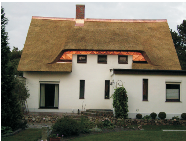
Neueindeckung - September 2008